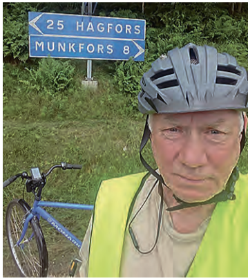
Cyklisten ätter å ha passer Klarälva på Höjebroa.