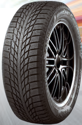
WINTERCRAFT ice wi51