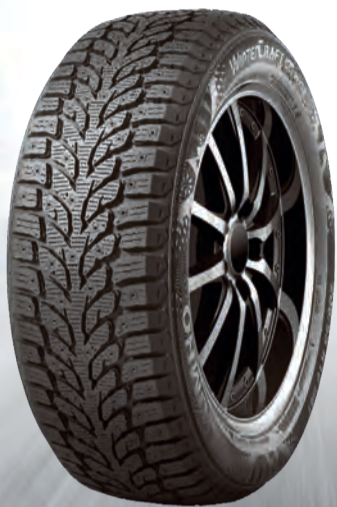
WINTERCRAFT ice wi32